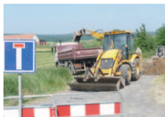
VÝKOPOVÉ práce v Bukové u Příbramě.

„Vzhledem k rozsahu projektu se celková cena vyšplhala na 33,4 milionu korun, přičemž dotace Operačního