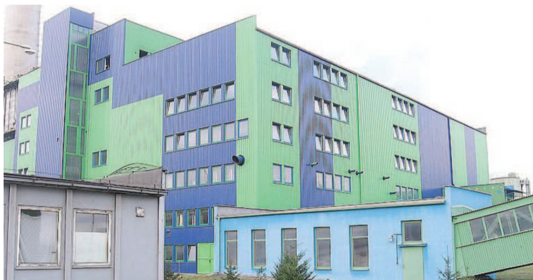
PŘÍBRAMSKÁ teplárna.

Lze veřejně zjistit, že podstatnou část akcií Příbram-